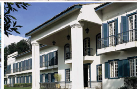
Venda de Fazendas