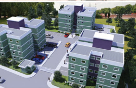
Residencial Estação Real