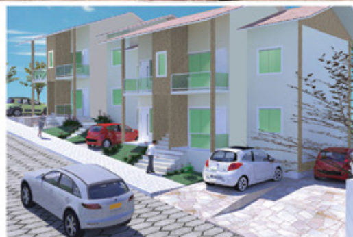
Condominio Park II